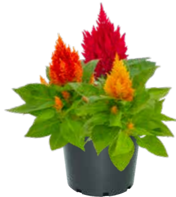
Celosia 'Kimono Trio'