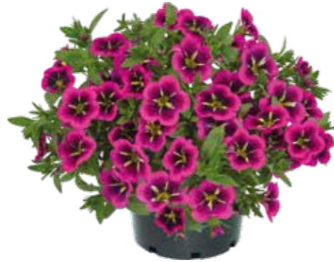
Calibrachoa 'Good Night Kiss'