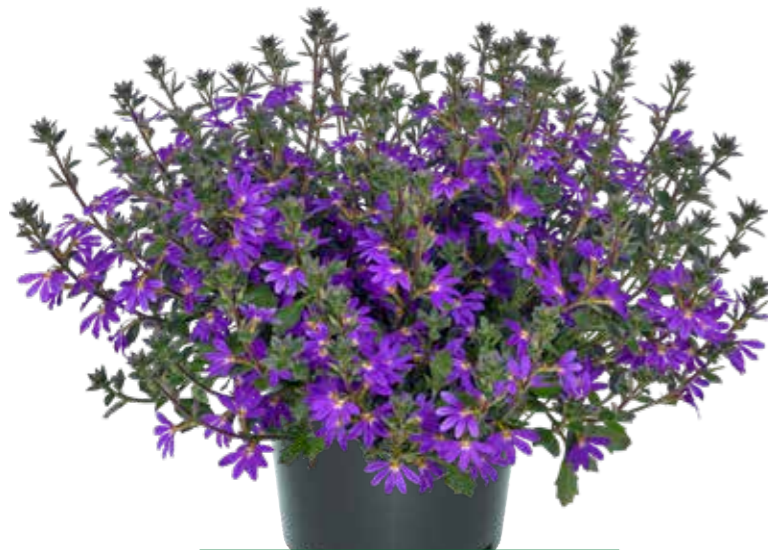
Scaevola 'Surdiva Deep Violet Blue'