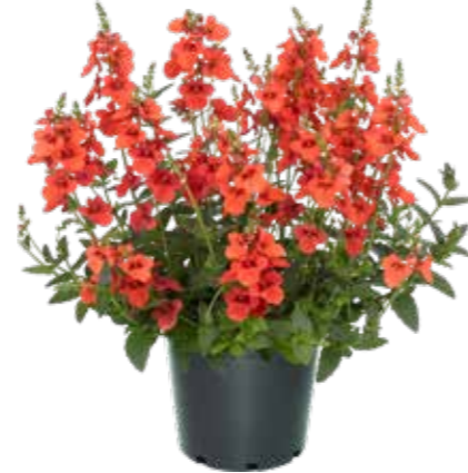
Diascia 'Trinity™ Sunset'