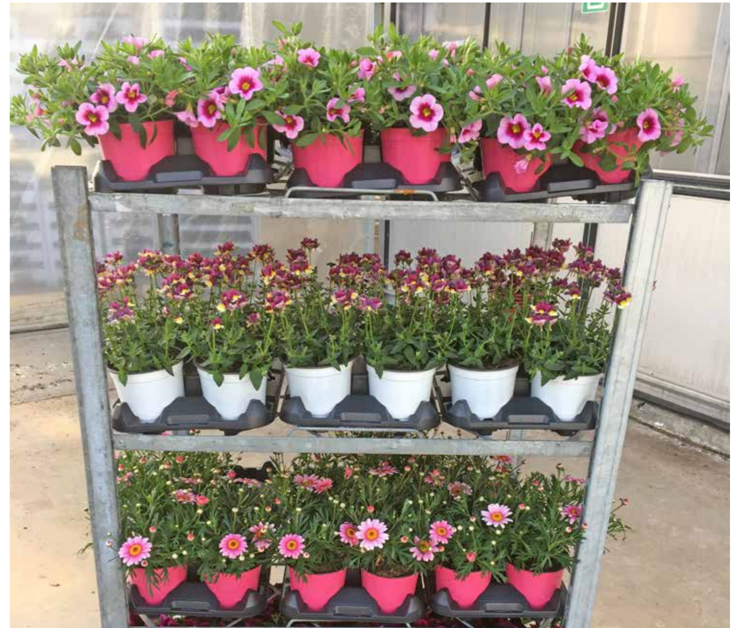
Vorschlag EC-Container Ton in Ton