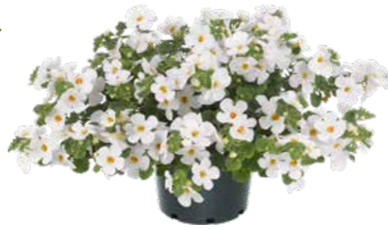
Bacopa 'Mega Copa White'