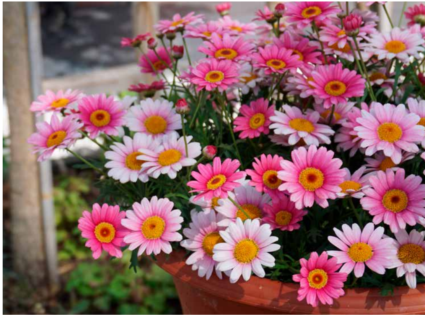
Argyranthemum 'Madeira™ Pink Halo'