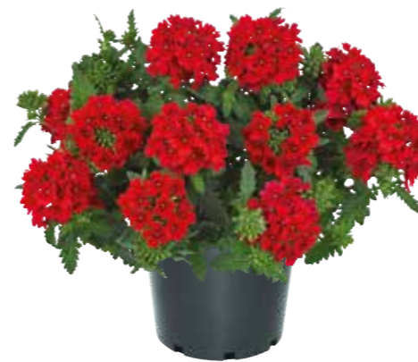
Verbena 'Firehouse Red'