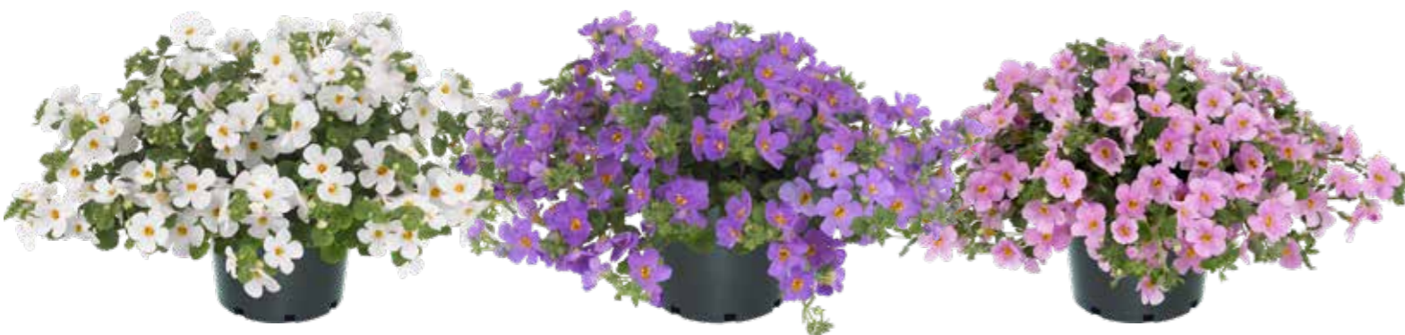
'Mega Copa White'

Großblumige Serie mit einer besseren zentralen Verzweigung als bei herkömmlichen Bacopas.