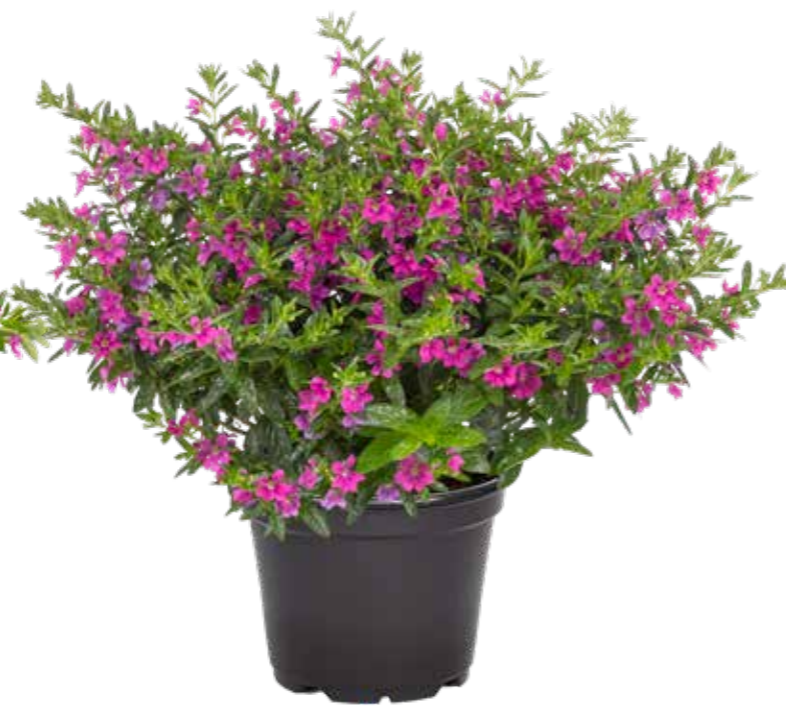
Cuphea 'Myrtis Nr 1 Purple'