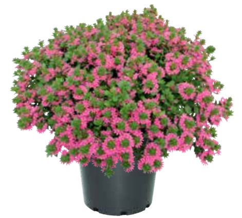
Scaevola 'Surdiva Pink Fashion'