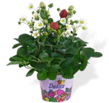
Fragaria ananassa 'Delizz'