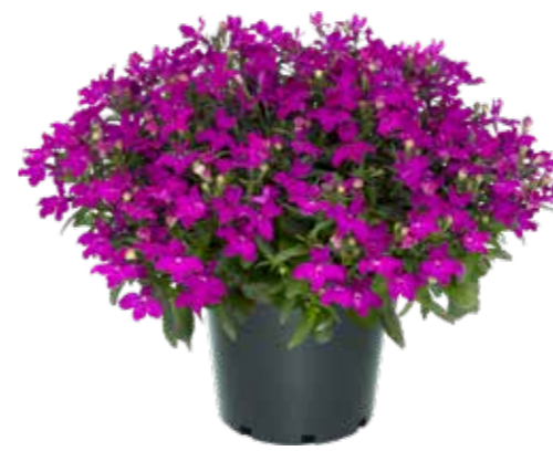
Lobelia 'Sweet Springs Purple'