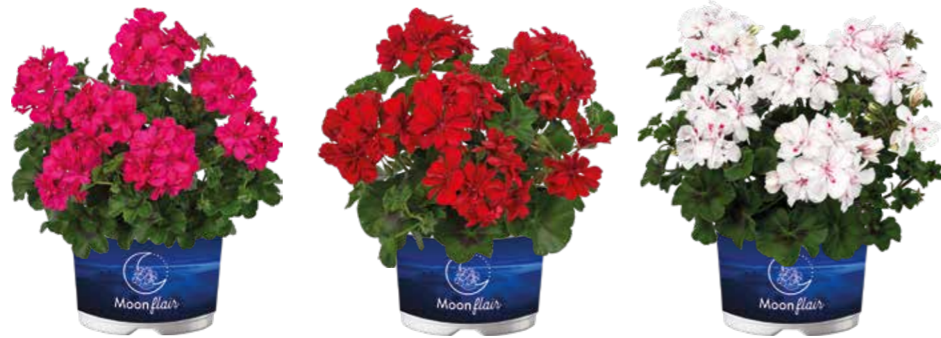
Moonflair 'Dark Pink'