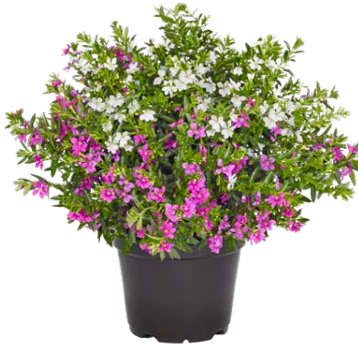
Cuphea 'Myrtis Duo'