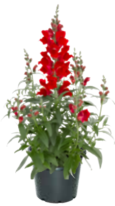
Antirrhinum 'Canytops Red'