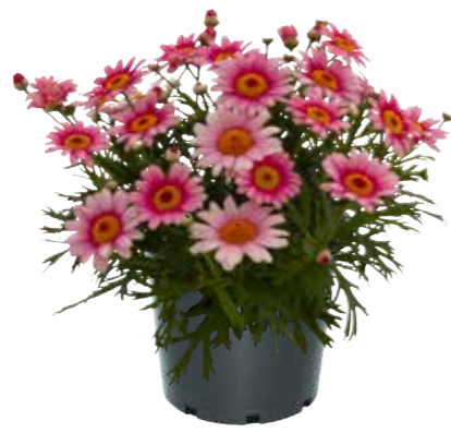
Argyranthemum 'Pink Halo'