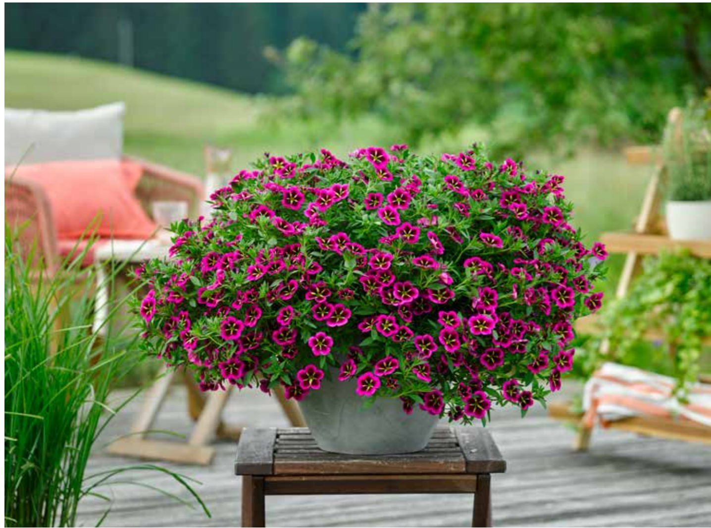
Calibrachoa 'Good Night Kiss'