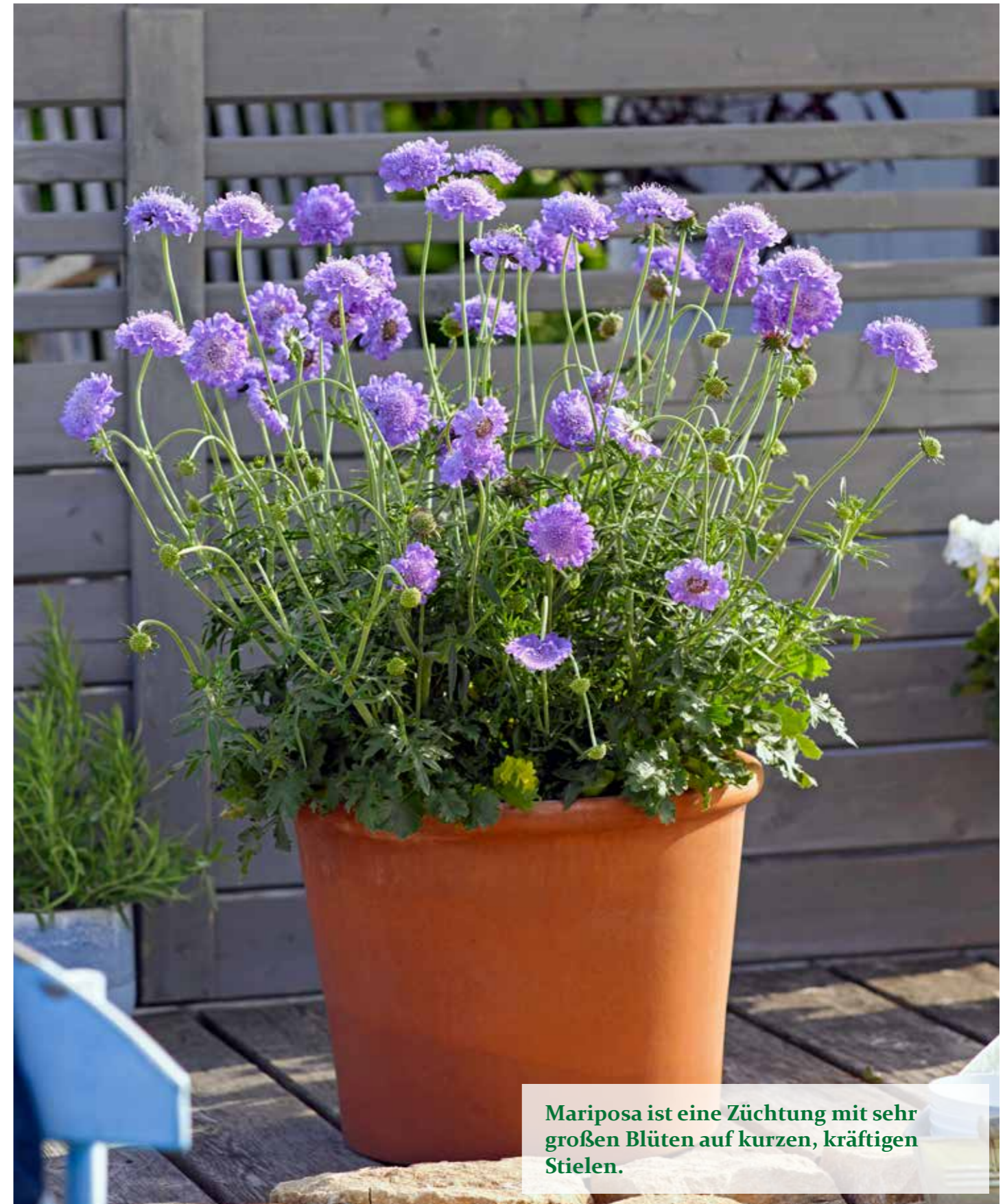
Mariposa ist eine Züchtung mit sehr großen Blüten auf kurzen, kräftigen Stielen.