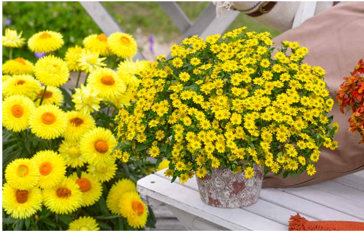
Bracteantha 'Granvia® Gold, Sunvitalia 'Santiago Great Yellow'