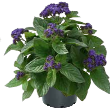
Heliotropium 'Honey Blue'