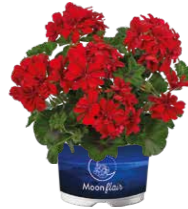
Pelargonium 'Moonflair Red'