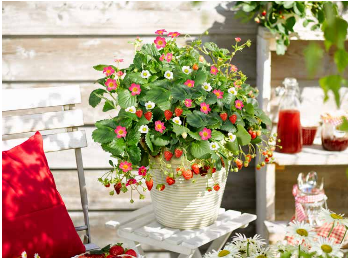
Fragaria ananassa 'Delizz, Toscana Deep Rose'