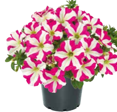
Petunia 'Amore Pink Heart'