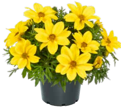
Bidens 'Sixbi Pop'