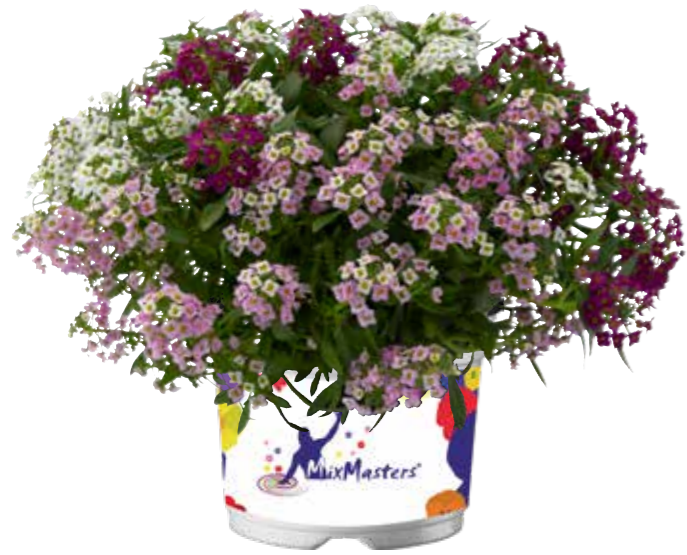
Lobularia 'MixMasters® Heaven Scent™ Impr.'