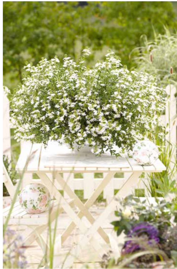
Scaevola 'Surdiva White'