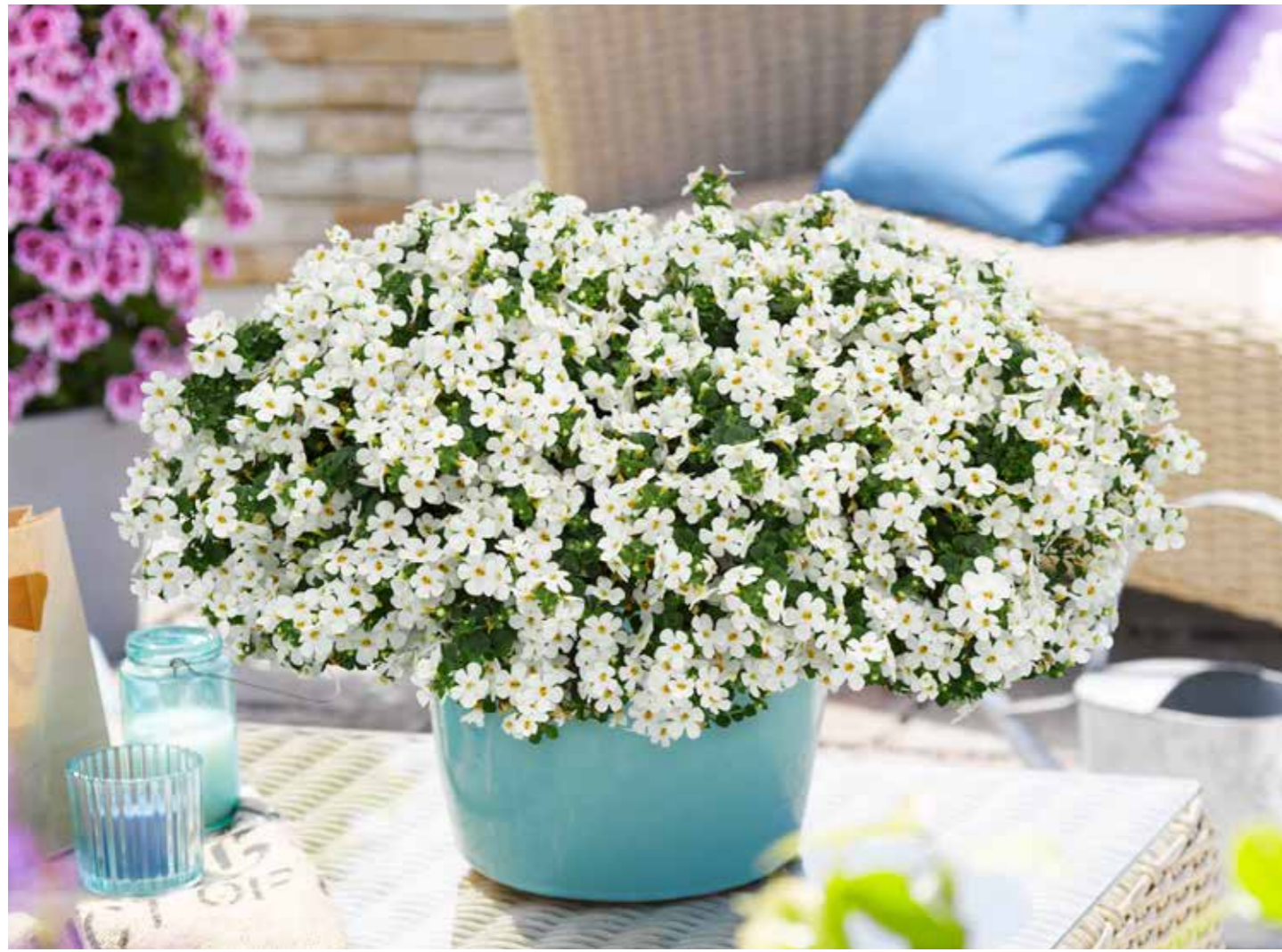
Bacopa 'Mega Copa White'