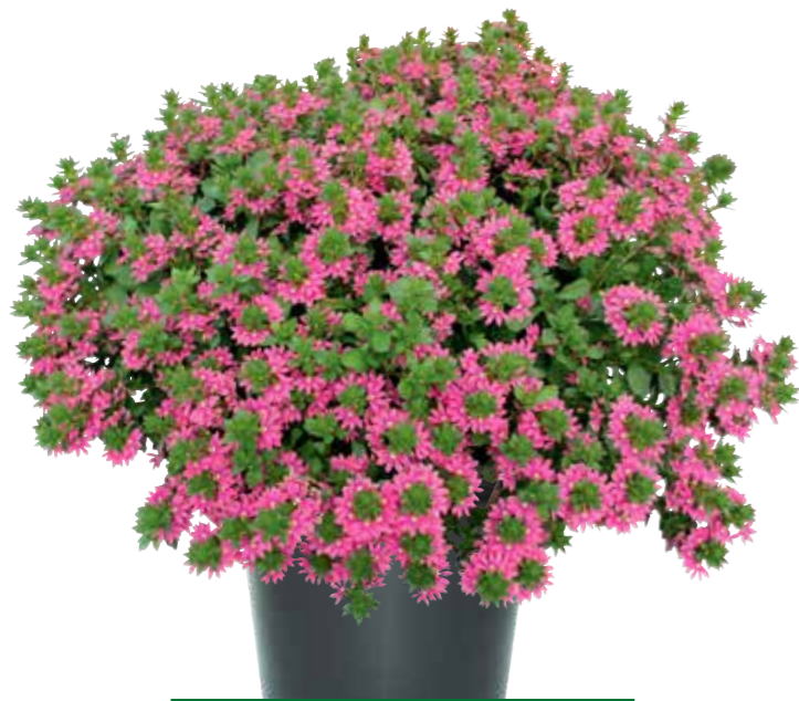
Scaevola 'Surdiva Pink Fashion'