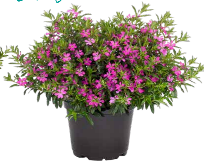
Cuphea 'Myrtis Nr 7 Pink'