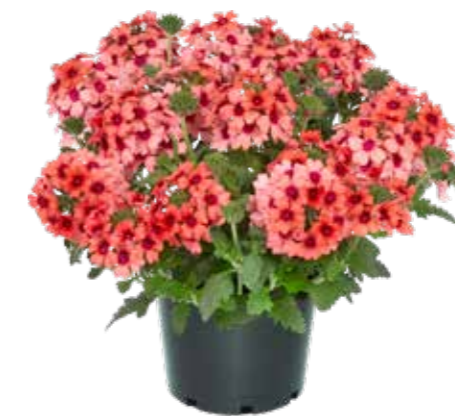
Verbena 'Lobster Fest'