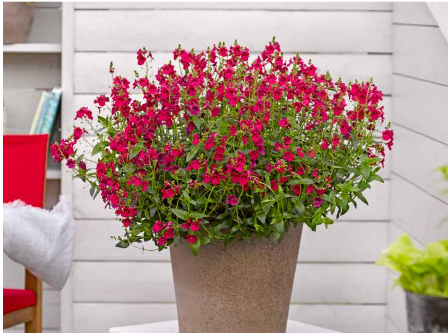
Diascia 'Trinity' TM Pink'