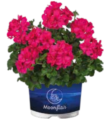
Pelargonium 'Moonflair Dark Pink'