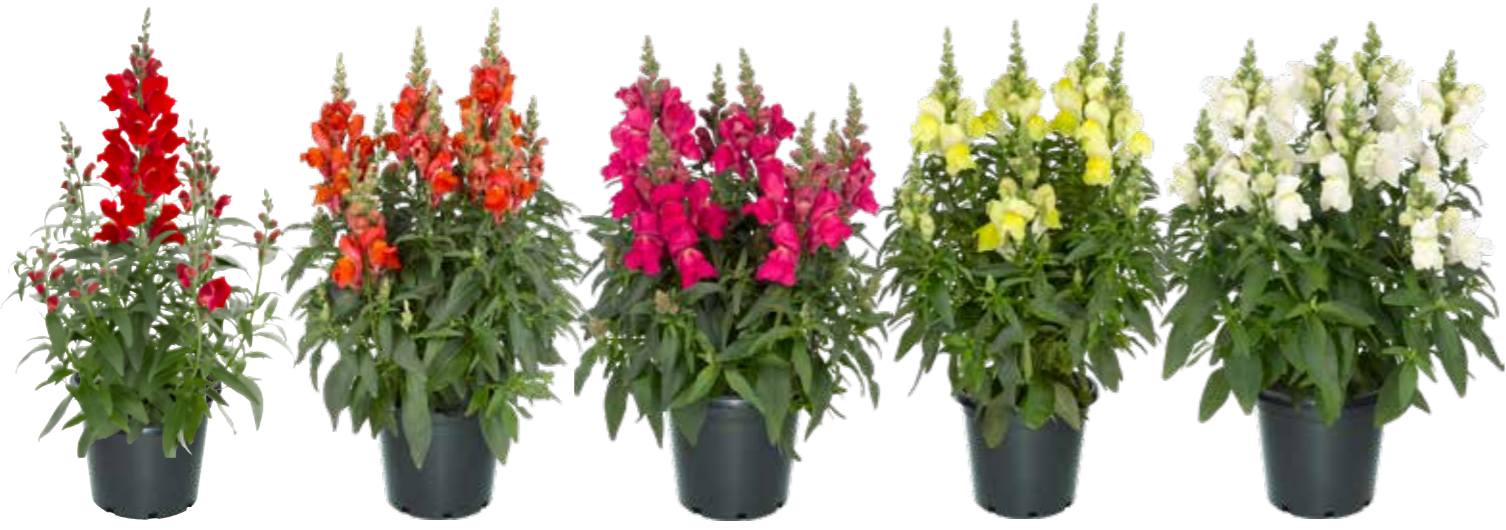
Red Orange Rose Yellow White