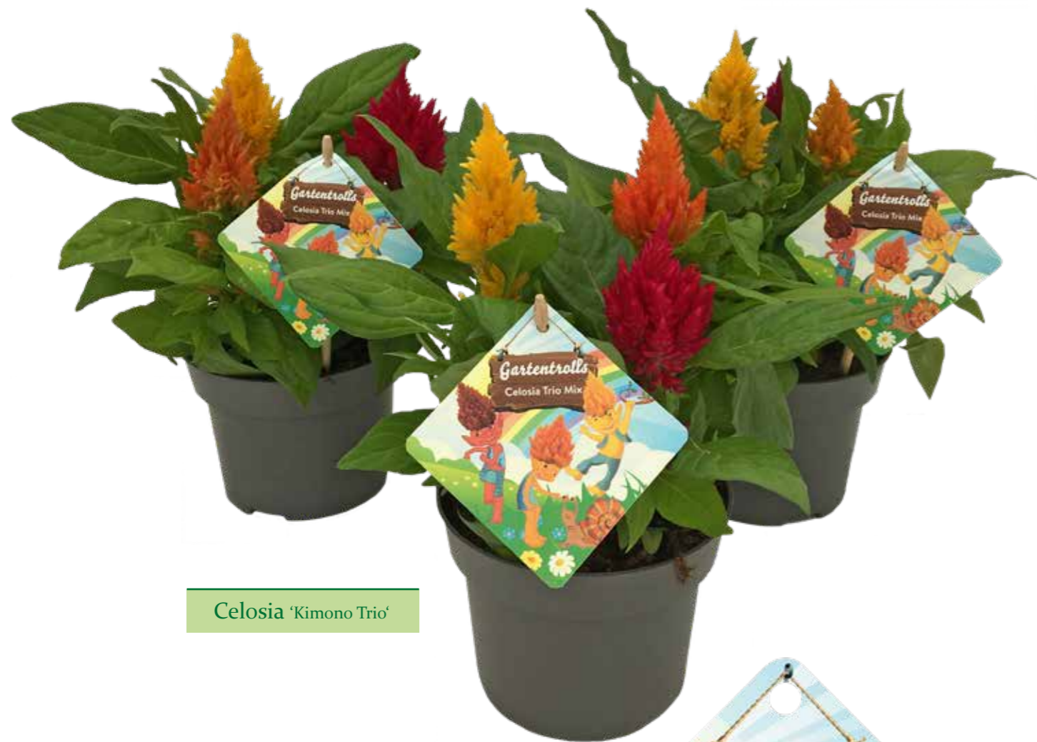
Celosia 'Kimono Trio'