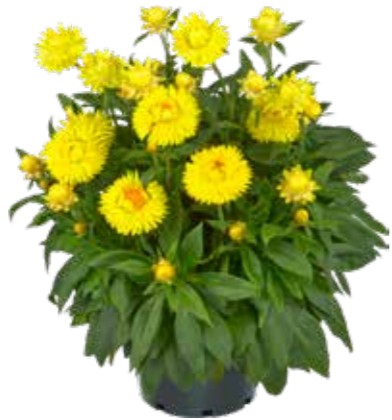
Bracteantha 'Granvia® Gold'