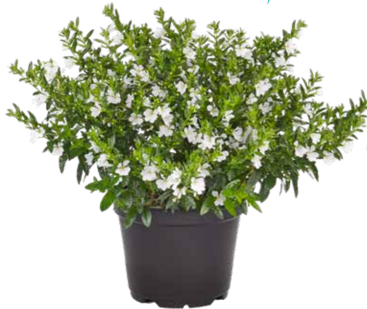
Cuphea 'Myrtis Nr 4 White'