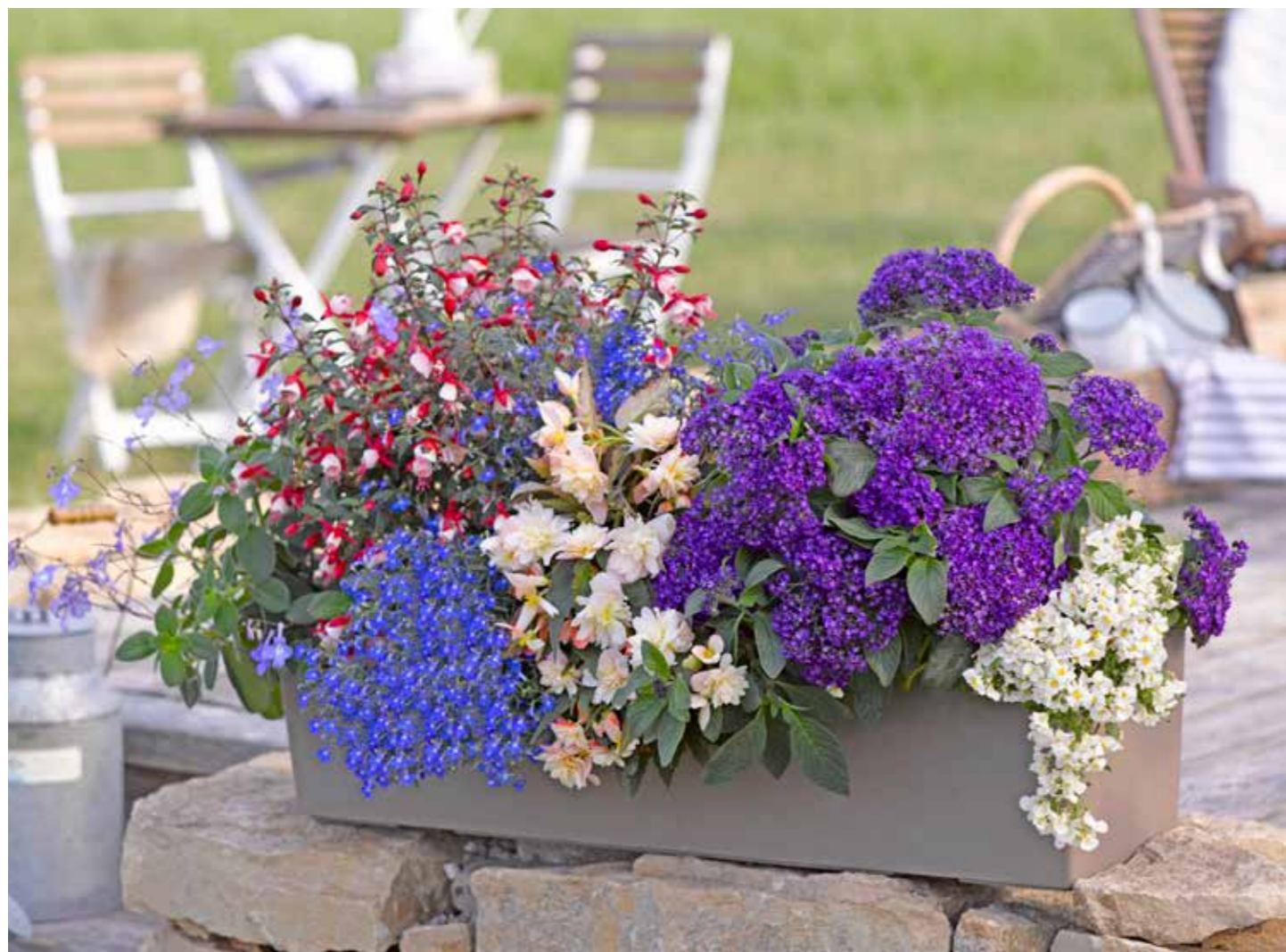
Heliotropium 'Honey Blue'