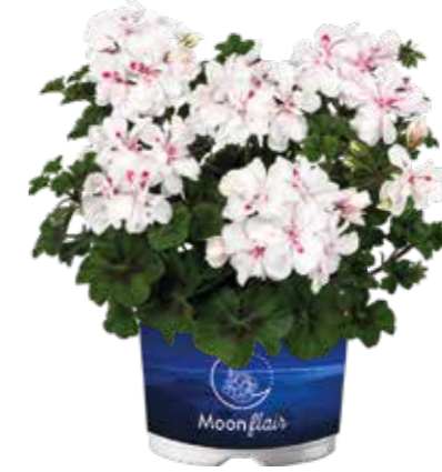
Pelargonium 'Moonflair White'