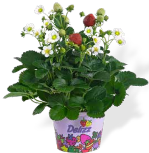
Fragaria ananassa 'Delizz'

Delizz F1 – Einfach in der Kultur und unwiderstehlich im Geschmack! Ein sehr hoher Ertrag während der gesamten Saison.