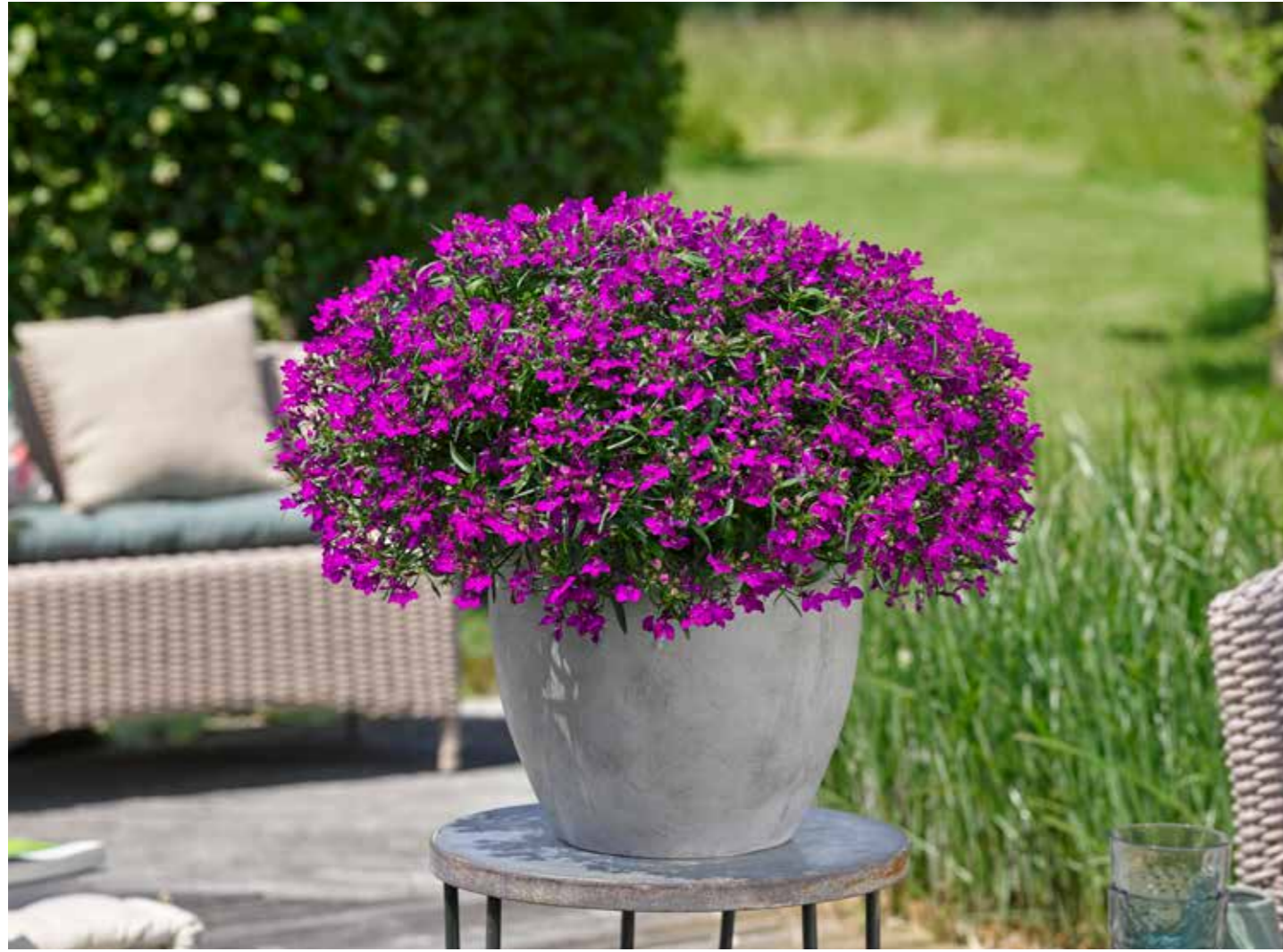
Lobelia 'Sweet Springs Purple'