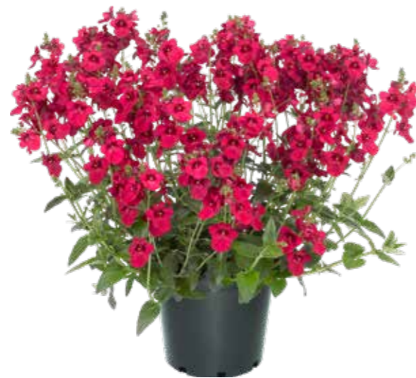
Diascia 'Trinity' TM Pink'