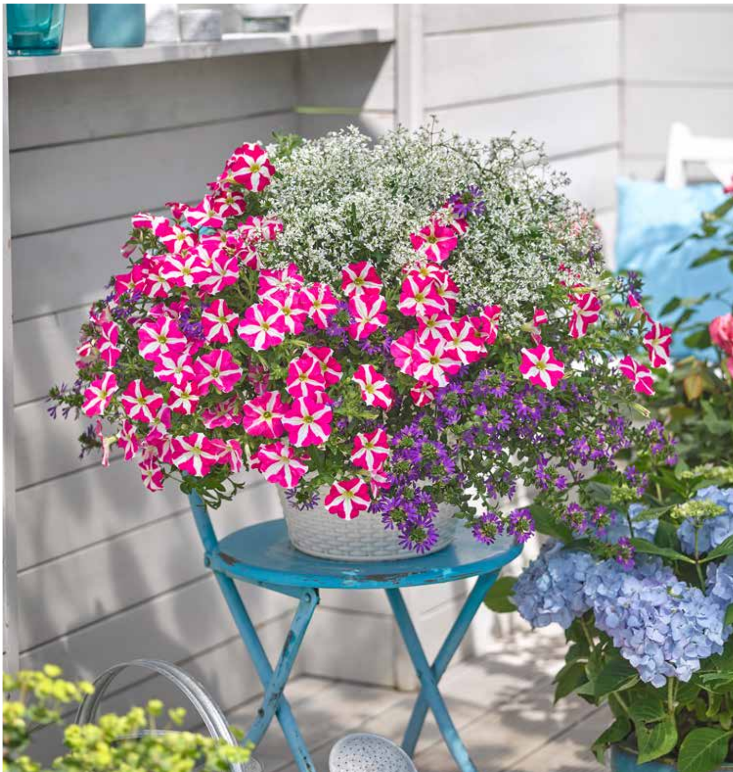
Petunia Amore Pink Heart, Euphorbia Euphoria, Scaevola Surdiva Deep Violet Blue